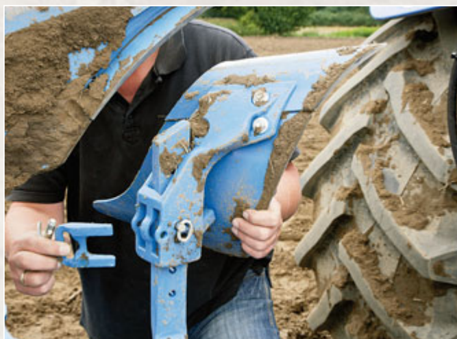
Neben der Höhe kann mit einem Keil auch der Wurfwinkel um 6° verstellt werden. Leider öffnen die Klappsplinte schon mal ungewollt und Bolzen samt Keil kann verloren gehen. Mittlerweile gibt es verschiedene Vorschälerformen, da „unsere“ auf schwerem, nassem Boden stopfte.