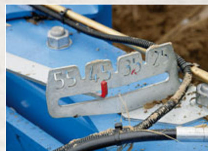
Die Skala fängt zwar bei 25 cm an, aber minimal sind bei dem Juwel nur noch 30 cm Schnittbreite/Körper möglich, maximal 55 cm.

Die werkzeuglose Verstellung der Vorschäler hat beim Juwel jetzt neben der Höheneinstellung einen Keil, mit dem der Wurfwinkel um 6° verstellt werden kann. Das geht gut, nur die einfachen Klappsplinte sind verlustgefährdet.