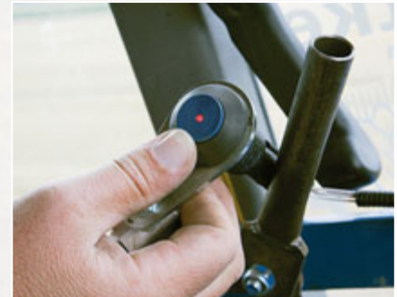
Per Taster kann man die Schnittwinkelverstellung frei schalten und abspeichern. Der Taster für die Kabine kostet allerdings 130 Euro extra.

■ Das auf Wunsch lieferbare 50-cm-Scheibensech kann weit vor dem Körper montiert werden. Damit gab es selbst in Maisstroh keine Verstopfungen mehr.