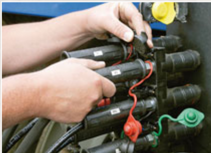
Die Liebe zum Detail erkennt man bereits an der Beschriftung der sechs Ölschläuche und der Schlauchgarderobe.

Bleibt noch das komplett neu entwickelte Stütz- und Transportrad des Juwel. Es ist mit der Größe 340/55-16 sehr ordentlich bereift, und für immerhin 3 360 Euro gibt es eine hydraulische Tiefenverstellung über ein separates dw-Ventil. Das ist eine feine Sache, gestört hat uns nur, dass man die eingestellte Tiefe nicht bei ausgehobenem Pflug ablesen kann und der sehr filigrane Zeiger durch Kluten schon mal verbogen wurde. Diese und auch andere Startschwierigkeiten z. B. mit einem Strömungsventil oder der eigenständigen Tiefenverstellung hat Lemken selber erkannt und nach eigenen Angaben bereits abgestellt.