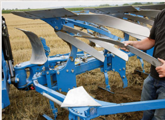
Die neuen „DuraMaxx“-Körper haben keine Schraubenlöcher mehr und können ohne Werkzeug zerlegt werden – genial! Die Haken an den Streifen sind mit Industriekleber aufgeklebt!

Was den Rahmen angeht, hat sich beim Juwel 8 an der Dimension (140 x 140 x 10 mm) im Vergleich zum VariOpal nichts getan. Entsprechend dürfte es auch beim Gewicht keinen allzu großen Unterschied geben. Der 6-furchige Juwel wog jedenfalls in