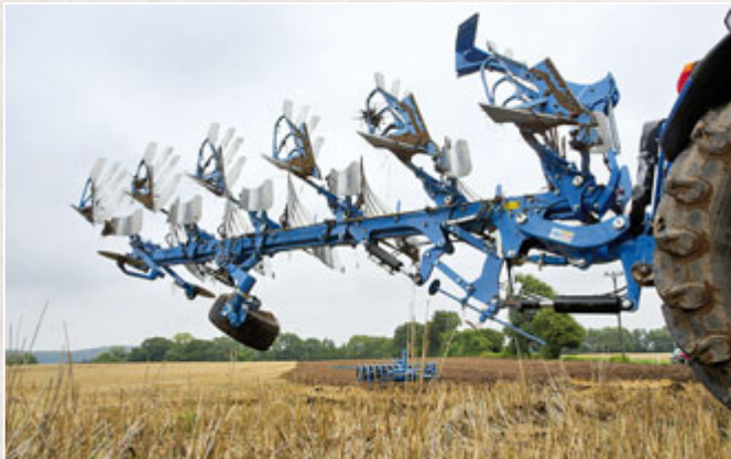
Dank Rahmenschwenkzylinder hat selbst der 6-furchige Juwel bei jeder Einstellung und Schnittbreite reichlich Bodfreiheit zum Drehen.

Wahlweise kommen noch Dinge wie das Scheibensech (1 000 Euro), der Packerarm (1 550 Euro) und der Rahmenschwenkzylinder (1 500 Euro) bzw. alternativ die hydraulische Vorderfurchenbreitenverstellung (2 340 Euro) hinzu. Außerdem kann man den Juwel mit der neuen hydraulischen Steinsicherung „Hydromatic“ für 6 415 Euro extra bestellen.