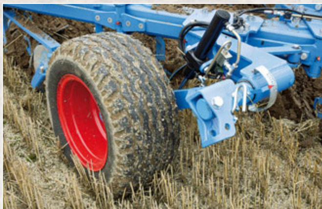
Das Unirad ist schön groß, die hydraulische Verstellung der Arbeitstiefe kostet aber über 3300 Euro extra. Skala und Zeiger wurden mittlerweile verbessert, sie zeigen die eingestellte Tiefe aber nur, wenn der Pflug in der Furche steht.

Reagiert hat man bei Lemken auch auf die sich ändernden Schlepper: Um bei immer geringer werdenden Spur-Innenmaßen (aufgrund breiterer Reifen) den Pflug mit dem bekannten „OptiQuick“ richtig einstellen zu können, ist der Hauptlenker heute gekröpft. Zur Einstellung der Vorderfurchenbreite hatte unser Pflug leider nur eine Feingewindespindel am neuen Rahmenschwenzylinder, die nicht mal eine Ansatzmöglichkeit für einen Schlüssel hatte. Hier würden wir immer die hydraulische Verstellung empfehlen, da sie im Vergleich zum Rahmenschwenzylinder nur 840 Euro mehr kostet.