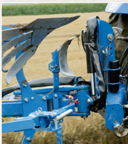
Das Bordwerkzeug sitzt jetzt rechts am Turm, und die Kunststoffrolle ersetzt den Werkzeugkasten.

Gerade beim Streifenkörper macht sich auch die neue Konstruktion bemerkbar: Die Streifen selber haben keine „tragende“ Funktion mehr, da sie selber auf einen Träger „aufgehakt“ werden. Das bedeutet, man kann sie noch viel weiter herunterfahren wie früher, da sie natürlich erst sehr viel später ihre